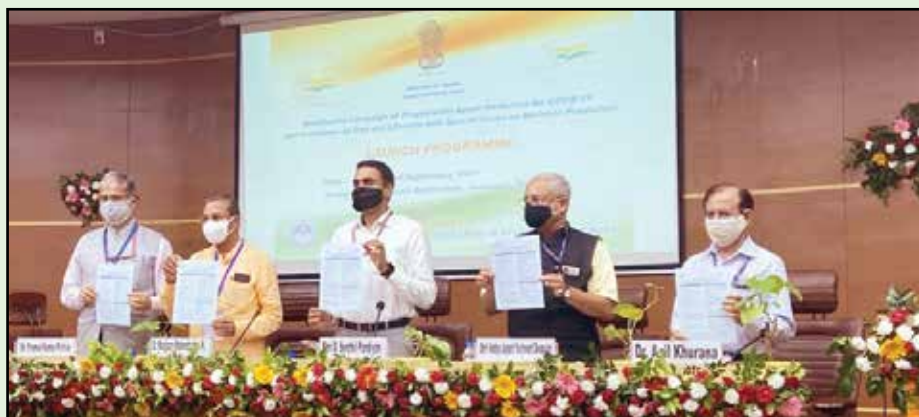
Hon'ble Minister Dr. Munjpara Mahendrabhai Kalubhai and other dignitaries releasing 'Unani Medicine-based diet and lifestyle guidelines for promoting immunity during COVID-19 pandemic' during the launch of the campaign for distribution of Ayush prophylactic medicines and lifestyle guidelines to mark Amrit Mahotsav on September 2, 2021.

The campaign was formally kick-started by Hon'ble Union Minister of Ayush and Ports, Shipping & Waterways Shri