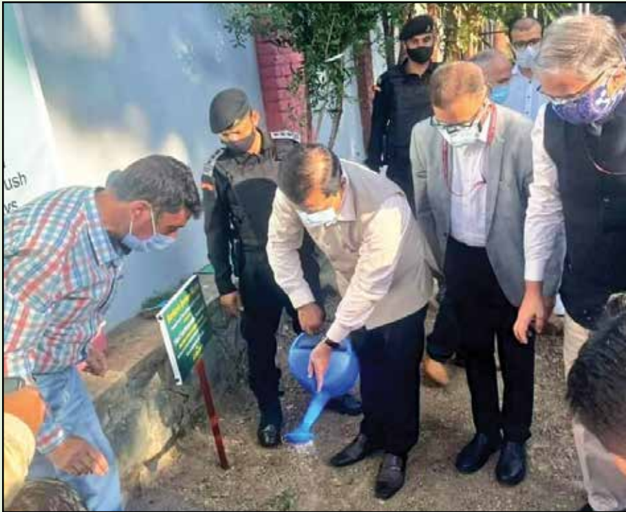
Hon'ble Minister Shri Sarbananda Sonowal watering a plant during the plantation drive at RRIUM, Srinagar to mark Hon'ble Prime Minister Shri Narendra Modi's birthday on September 17, 2021.

at the RRIUM and interacted with OPD and IPD patients to know about their health condition and get their feedback about the quality of health care provided to them. He also visited and appreciated testing and research labs as well as various research sections of the institute and stressed for their further strengthening.