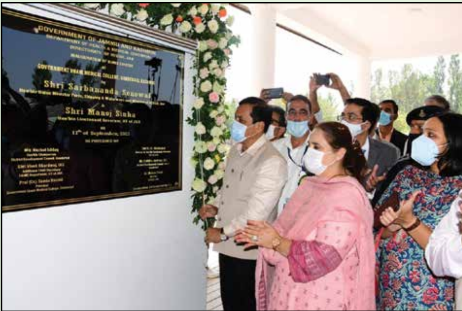
माननीय मंत्री श्री सर्बानंद सोनोवाल 17 सितंबर 2021 को सरकारी यूनानी मेडिकल कॉलेज एवं अस्पताल, गांदरबल, जम्मू - कश्मीर में बीयूएमएस पाठ्यक्रम का उद्घाटन करते हुए।