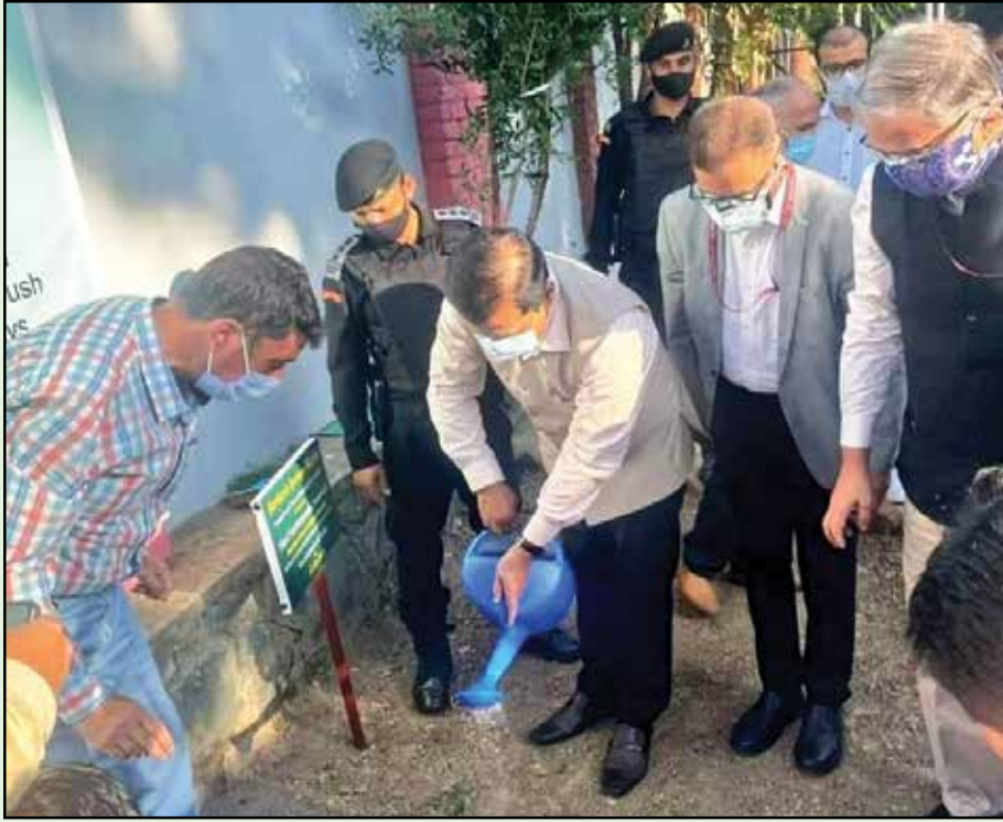
माननीय प्रधान मंत्री श्री नरेंद्र मोदी के जन्मदिन के अवसर पर माननीय मंत्री श्री सर्वानंद सोनोवाल 17 सितंबर 2021 को के.यू.चि.अ.स., श्रीनगर में वृक्षारोपण अभियान के दौरान पौधे को पानी देते हुए।

सुविधाओं का दौरा किया और ओपीडी एवं आईपीडी के रोगियों से स्वास्थ्य स्थिति और स्वास्थ्य देखभाल की गुणवत्ता के बारे में बातचीत की। उन्होंने परीक्षण और अनुसंधान प्रयोगशालाओं समेत विभिन्न अनुसंधान अनुभागों का दौरा किया और उसकी सराहना की, साथ ही उन्हें और बेहतर करने पर बल दिया।