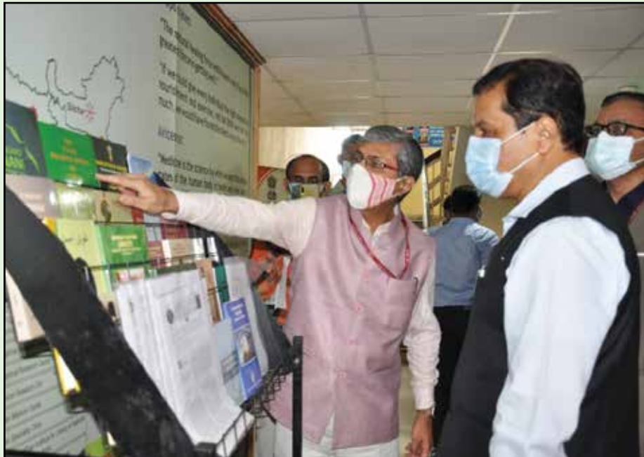
Vaidya Rajesh Kotecha, Secretary, Ministry of Ayush briefing Hon’ble Minister Shri Sarbananda Sonowal about research publications of the CCRUM.

and appreciated its functioning and research endeavours. He also appreciated the infrastructure of CCRUM’s institute in Srinagar that he visited a week ago. Further, he visited CCRUM library and was briefed about the large collection of about 200 manuscripts and as many as 17000 scientific documents. He was also informed about the scientific activities and publications of the CCRUM. Hon’ble Minister also showed keen interest in the research publications of the CCRUM. He also interacted with officers and scientists of all the offices in the premises of the CCCBC.