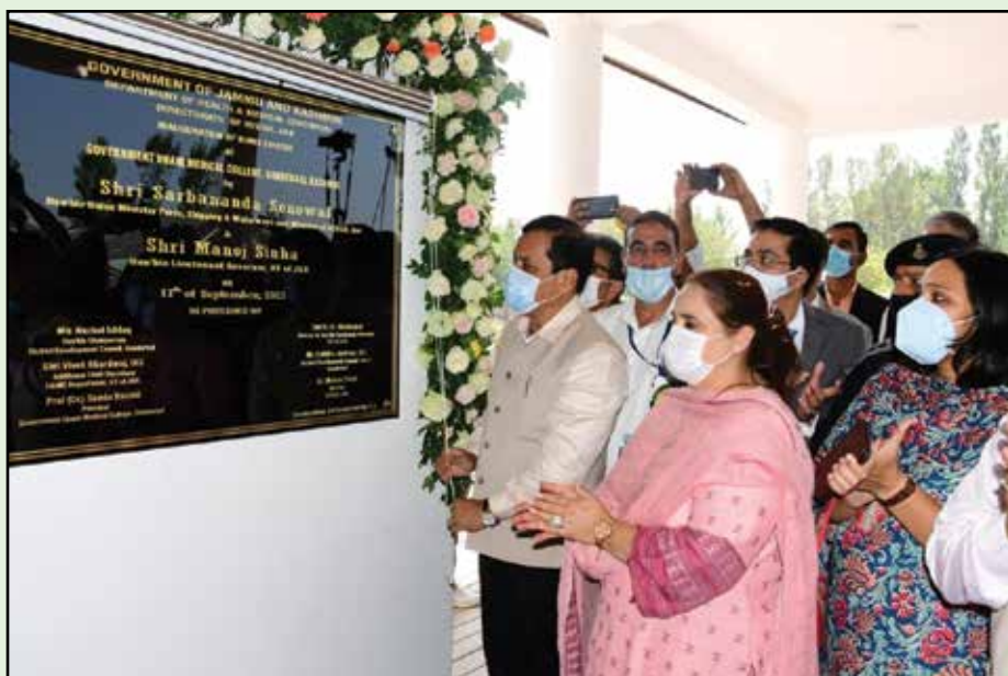
Hon'ble Minister Shri Sarbananda Sonowal inaugurating BUMS course at GUMC&H, Ganderbal, Jammu & Kashmir on September 17, 2021.

Later, Hon'ble Minister took round of OPD, operation theatre, various labs and all blocks of the academic building of the college